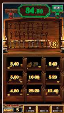
Las Cajas Fuertes