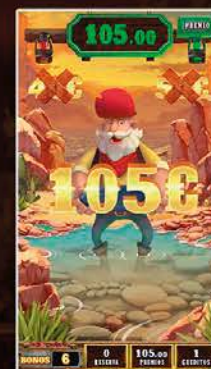
Juego Se Busca