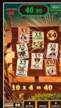
La fiebre del Oro